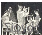
Ensemble Femminile "Sifnos" di Brescia