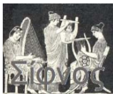
Ensemble Femminile " Sifnos " di Brescia